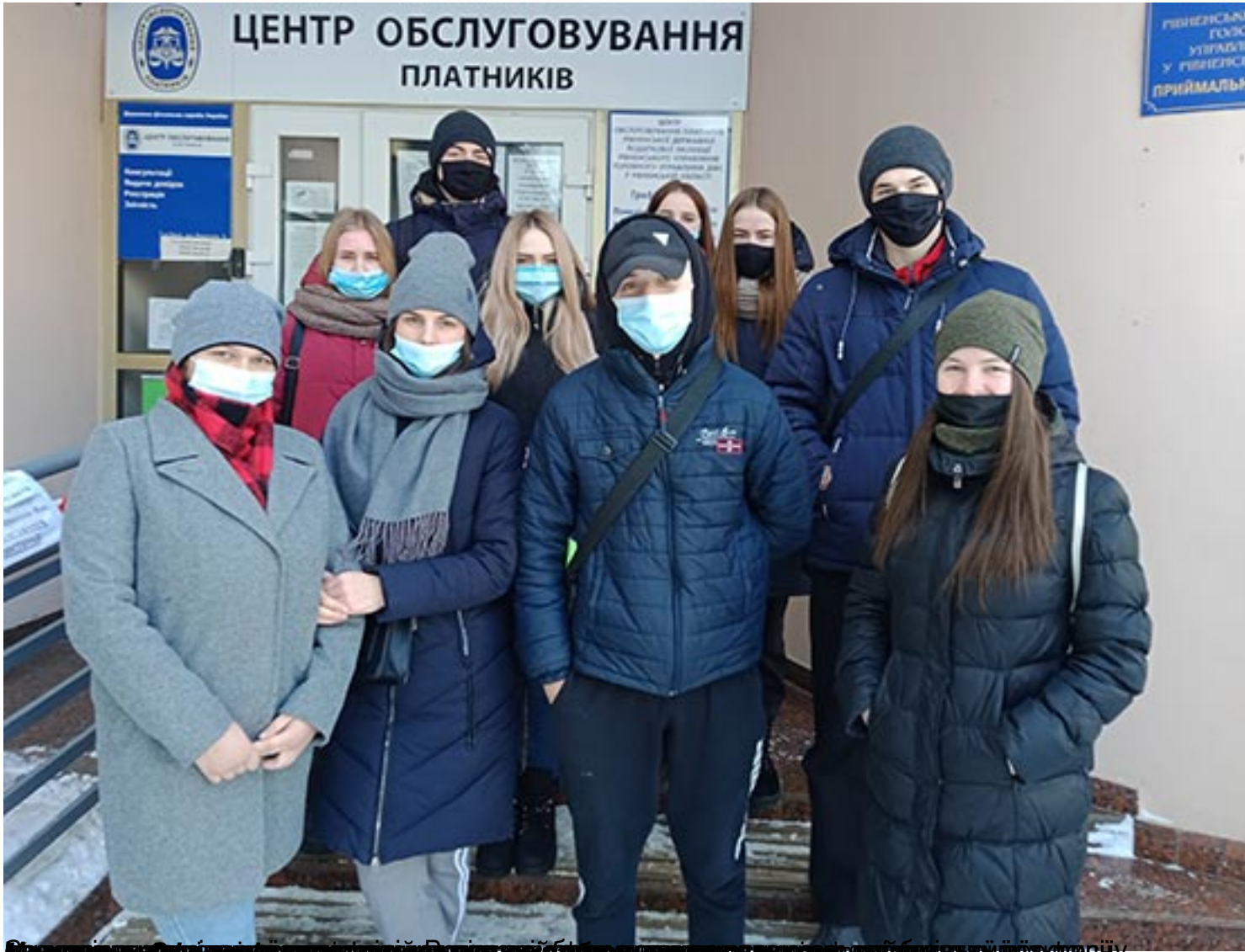
Відвідувачі платіжних сервісів у Центр обслуговування платників