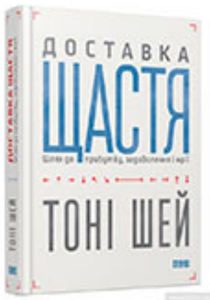
Тоні Шей «Доставка щастя»

Автори численних досліджень стверджують, що читання підвищує креативність і розвиває гнучкість мислення, допомагає боротися з упередженнями та підвищує рівень інтелекту. А ще із самого дитинства нам відомо, що книга - джерело знань. Саме знання, креативність, гнучкість і критичність мислення потрібні нам у сучасному світі.