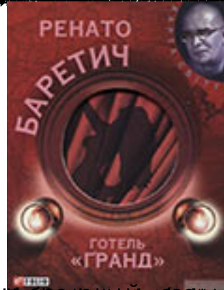
Ренато Бареттич «Готель «Гранд»» (Київ: Видавництво «Лань», 2010)