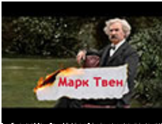
Шолом-Алейхем (Марк Твен) «Марк Твен» (Берлін: Видавництво «Лань», 2010)