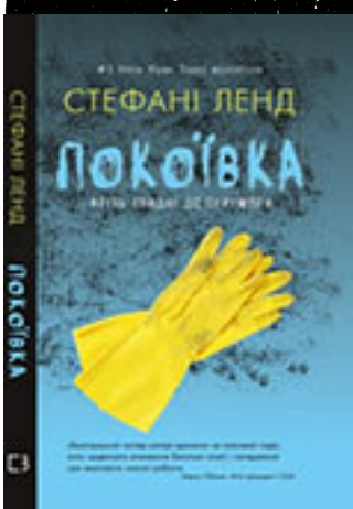
С. Ленд «Покоївка. Кризь злидні до перемоги»

Стефані 28 років, і вона відчайдушно намагається вирватися з рідного містечка, щоб справдити свою мрію: вступити до університету і стати письменницею. Ї